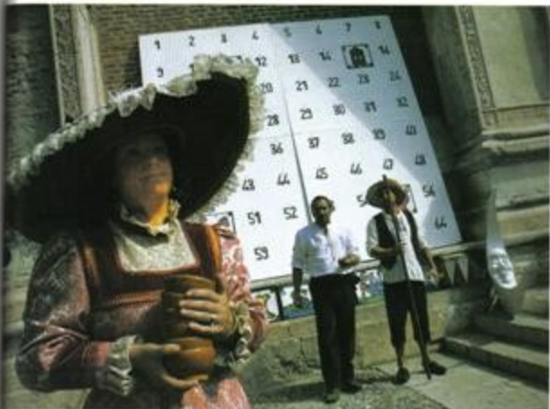
Όλα κινούνται στα νταβιά. Αριστοκράτες, εργατοκρατορικοί εργάτες, παλαιά αριστοκρατία του Άδριατικού Ωκεανού. Έτσι, το άσπαστο-ποικιλόχρωμο κολοσσαίο με τον υπερβολικό τρόπο, δε θέλουν με ένα σταθμό, και η κληρονομιά Ντόμινο Μπαρμπαρίσι ο Σιζάρδο τους παίζει με καρδιά, καρδιά

«Παξινοδιάρα» πόλη έγινε η Βερόνα τις μέρες του φεστιβάλ. Το ιστορικό της κέντρο, με την αναγεννησιακή και ενετική του κομψότητα, απέκτησε ελληνικό χρώμα, γεύση και ήχο - με επίκεντρο την Piazza dei Signori.